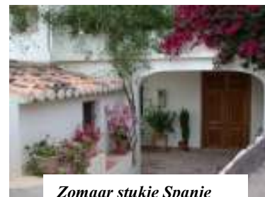
Zomaar stukje Spanje

Nou en gewacht hebben we!!!! Om 18.00 uur een SMS gestuurd, geen antwoord. Ik begin me zorgen te maken: panne onderweg? Ik stel voor dat we maar alvast een hapje gaan eten. Daarna ga ik bellen maar hun telefoon staat uit. Ik begrijp er niets van. Het verlossende telefoontje krijgen we om 21.00 uur. Ze zijn nog steeds in Frankrijk. Zij zijn verbaasd dat wij ze vandaag verwachten. Ze komen pas maandag. Dat is de afspraak. Ben ik ff weer in 'het' war geweest! Tolol dese; bestaat er ook nog zoiets als een domme brunette???????